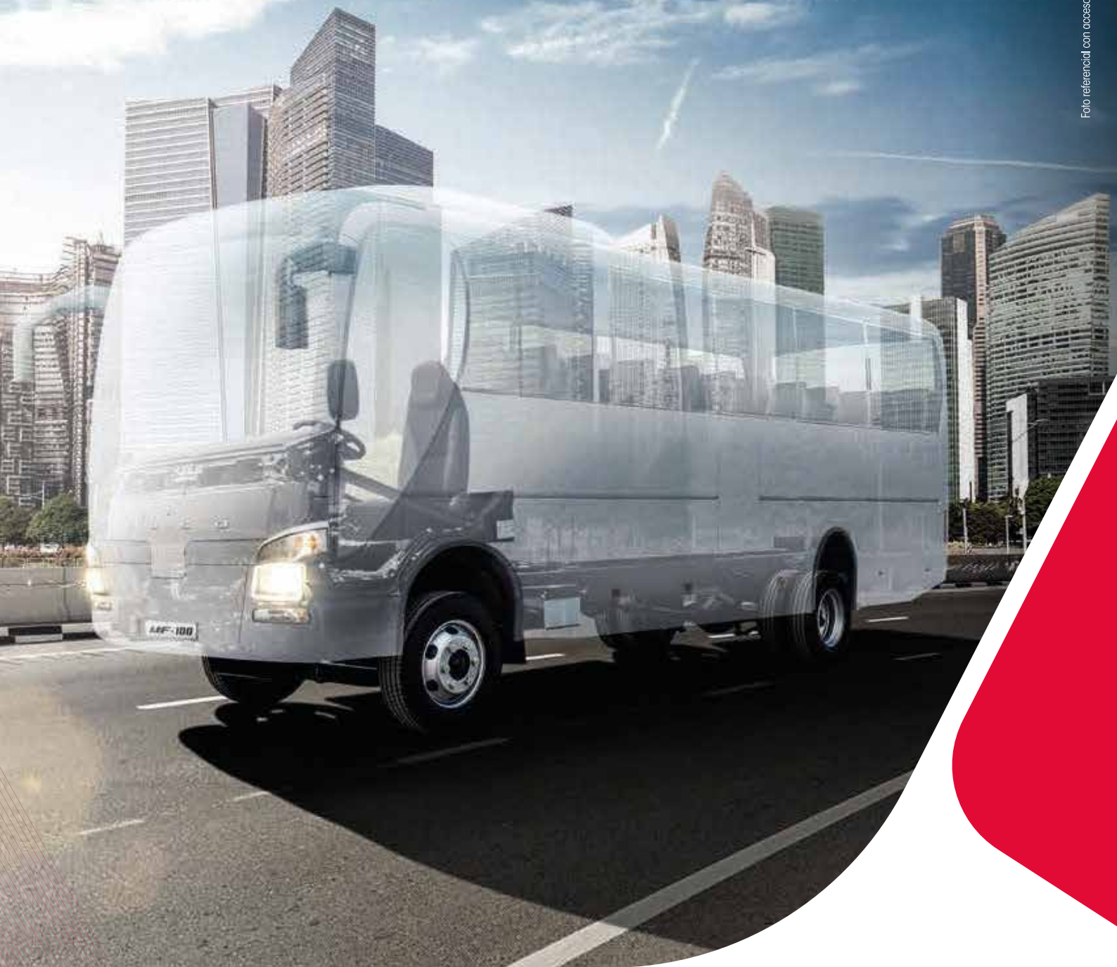
Foto referencial con accesorios.